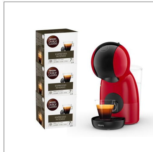
Piccolo XS rouge et 3 boîtes NDG espresso intense Machine expresso Nescafé Dolce Gusto et 3 boîtes de café Espresso Intenso YY4580FD