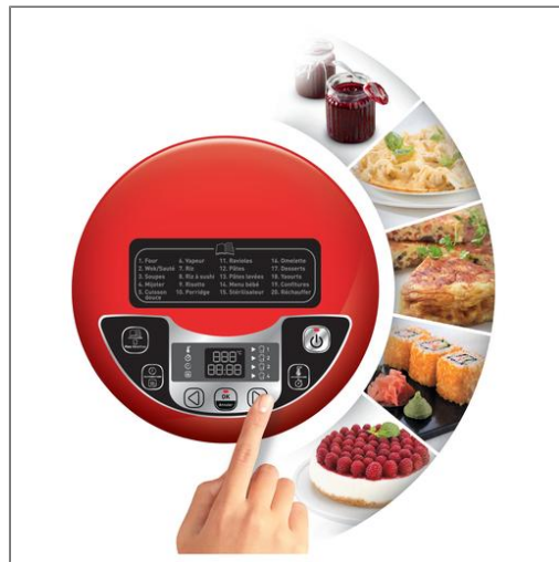
MULTICUISEUR 5L 25 Programmes BLANC GRIS MK708E10