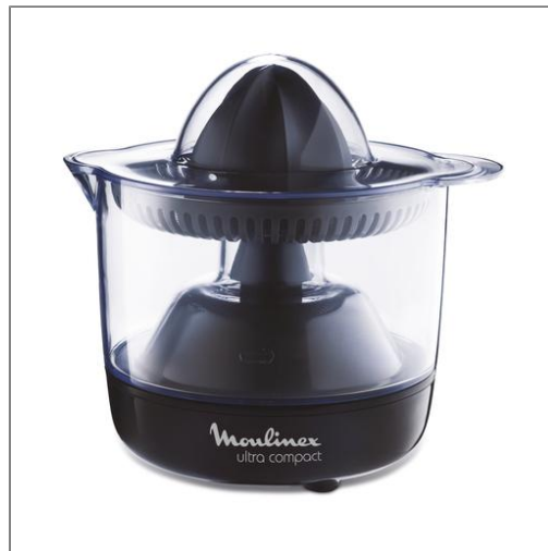
ULTRA COMPACT NOIR Presse-agrumes PC120870