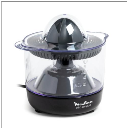
ultra compact citrus press