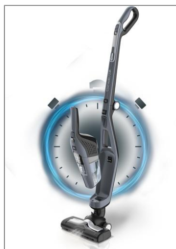
DUAL FORCE 2 EN 1 Aspirateur balai sans fil RH6756WO