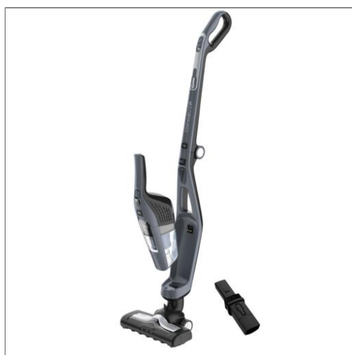
DUAL FORCE™ 2IN1