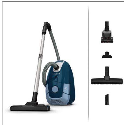
POWER XXL ANIMAL CARE Aspirateur avec sac R03172EA