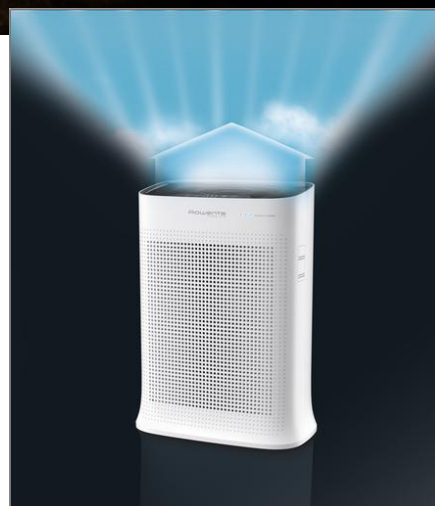
PURE AIR Purificateur d'air PU3040F0