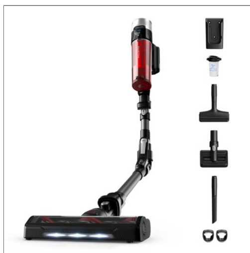
X-FORCE FLEX 9.60 Modèle animal Aspirateur balai sans fil multifonction RH2078WO