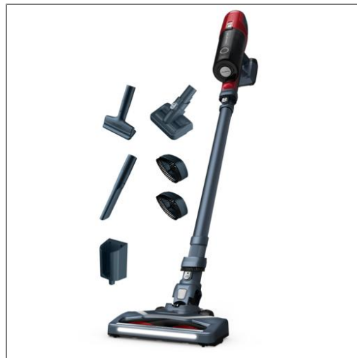
X-PERT 6.60 Modèle animal Aspirateur balai multifonction RH6878WO