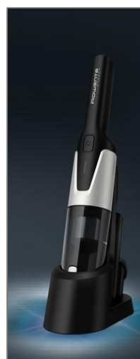
X-TOUCH Aspirateur à main sans fil AC9736WO