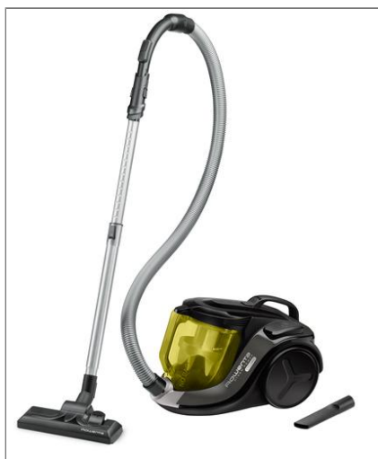
X-TREM POWER™ CYCLONIC