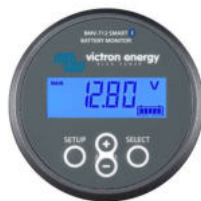
Contrôleur de batterie BMV-712 Smart