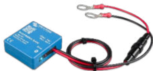
Smart Battery Sense Permet d'activer la charge à compensation de tension et de température.