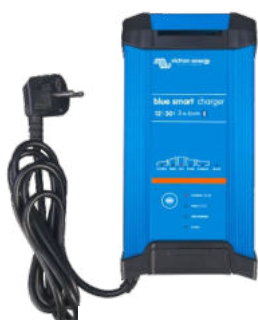
Blue Smart IP22 12/30 (3)