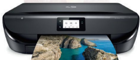
HP ENVY 5030

Pour l'achat d'une imprimante HP ENVY éligible.*