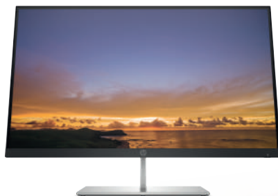
Ecran HP Pavilion 27 Quantum Dot

*Produits éligibles : HP 24o / HP 24y / HP 24w / HP 24m / HP 24ea / HP 24f / HP 24fw / HP 24fw with audio / HP 24fh / HP 25x / HP 25xq / HP 25mx.