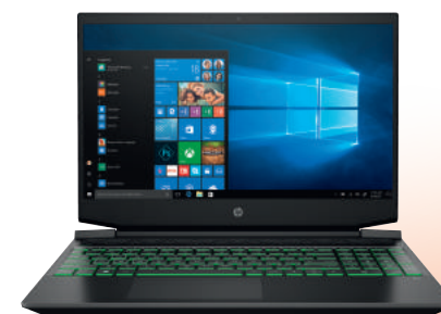
HP Pavilion Gaming Laptop 15-ec0002nf