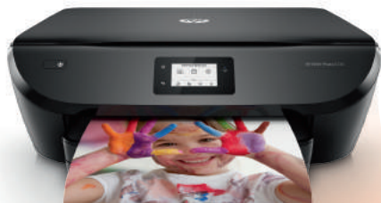
HP ENVY Photo 6230

*Imprimantes éligibles : HP ENVY 5030 / 5032 / 5050.