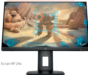
Ecran HP 24x

Pour l'achat d'un écran HP de 23,8 pouces et au-dessus.*