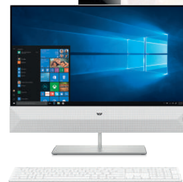
HP Pavilion All-in-One 24-xa1000nf

Pour l'achat d'un PC HP équipé d'un processeur AMD Athlon™ ou Ryzen™.*