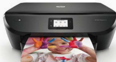
HP ENVY Photo

Pour l'achat d'une imprimante HP ENVY Pro, HP ENVY Photo, HP OfficeJet, HP OfficeJet Pro, HP Smart Tank et HP Sprocket éligible*