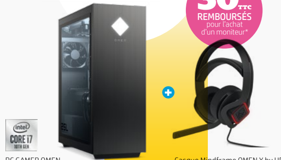
PC GAMER OMEN

+ 30€ TTC REBOURSÉS pour l'achat d'un moniteur*