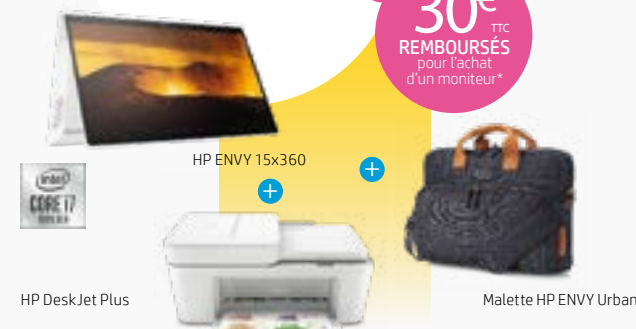
HP DeskJet Plus

+ 30€ TTC REBOURSÉS pour l'achat d'un moniteur*