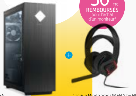
PC GAMER OMEN