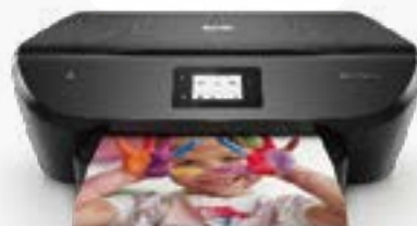
HP ENVY Photo

Pour l'achat d'une imprimante HP ENVY Pro, HP ENVY Photo, HP OfficeJet, HP OfficeJet Pro, HP Smart Tank et HP Sprocket éligible*