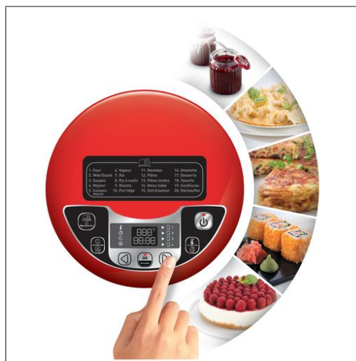
MULTICUISEUR 5L 25 Programmes BLANC GRIS MK708E10